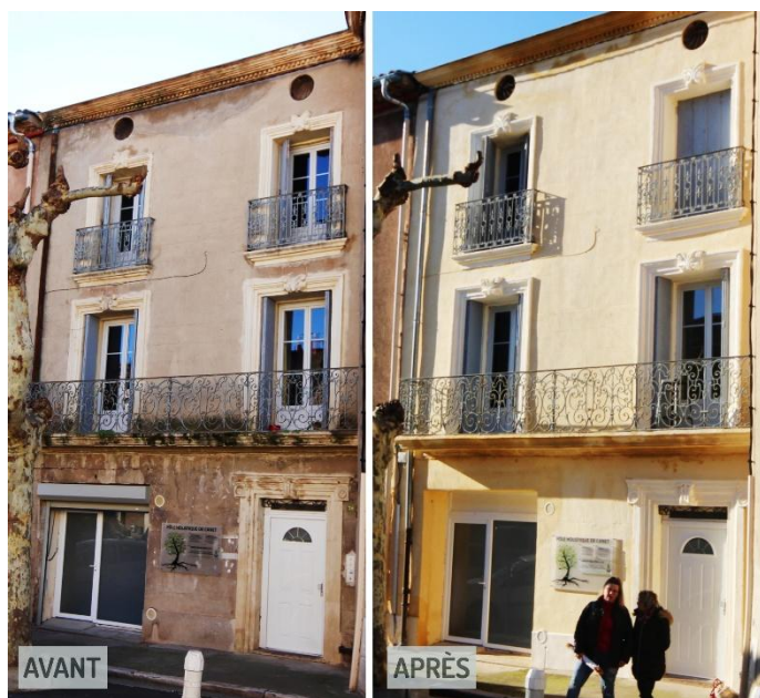
Bâtiment ayant bénéficié du Plan Rénovation Façades à Canet